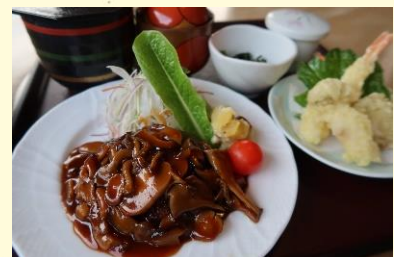
まる姫ハンバーグ定食